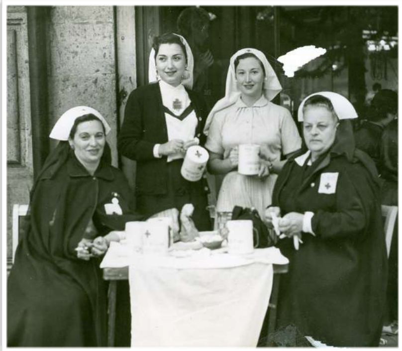
Colecta para la Cruz Roja organizada por el CMMI.

El Consejo Mexicano de Mujeres Israelitas (CMMI) fue una institución creada en 1962, cuando se independizó del Comité Central Israelita de México (hoy Comité Central de la Comunidad Judía de México), pues anteriormente pertenecía a dicho Comité bajo el nombre de Sección Femenina.