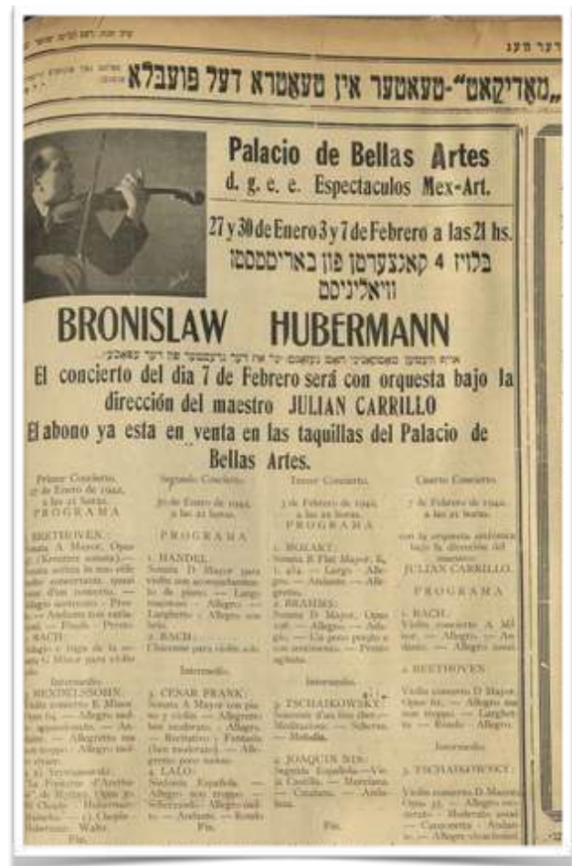
En este anuncio, publicado en 1942 en el periódico Der Weg , se detallan actuaciones de Bronislaw Huberman en el Palacio de Bellas Artes de la Ciudad de México.

A principios de 1942, Bronislaw Huberman estuvo en la Ciudad de México y ofreció cuatro conciertos en el Palacio de Bellas Artes. Una copia de su registro como extranjero, emitido por el Servicio de Migración en México, y varios anuncios de los conciertos que ofrecería,