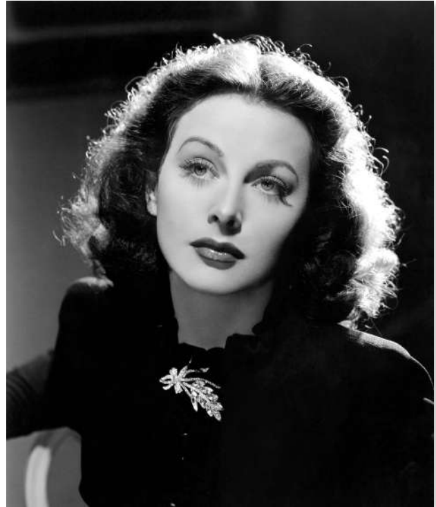
Foto promocional de Hedwig Kiesler como Hedy Lamarr.

Aunque comenzaba a disfrutar del éxito recién instalada en Estados Unidos y haciendo sus primeras películas con la MGM, en ese momento de su vida le llamaba más la ciencia que la actuación y su principal deseo era acabar con los soldados nazis, así que se dedicó a concebir un plan para poder lograrlo. Además de filtrar al gobierno norteamericano toda la información recopilada en las cenas con Adolf Hitler, Benito Mussolini y otros contactos de su ex marido, ella aprovechó esta información y