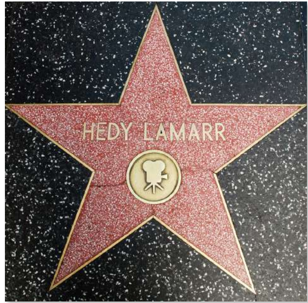
La estrella de Hedy Lamarr en el Paseo de la Fama de Hollywood.